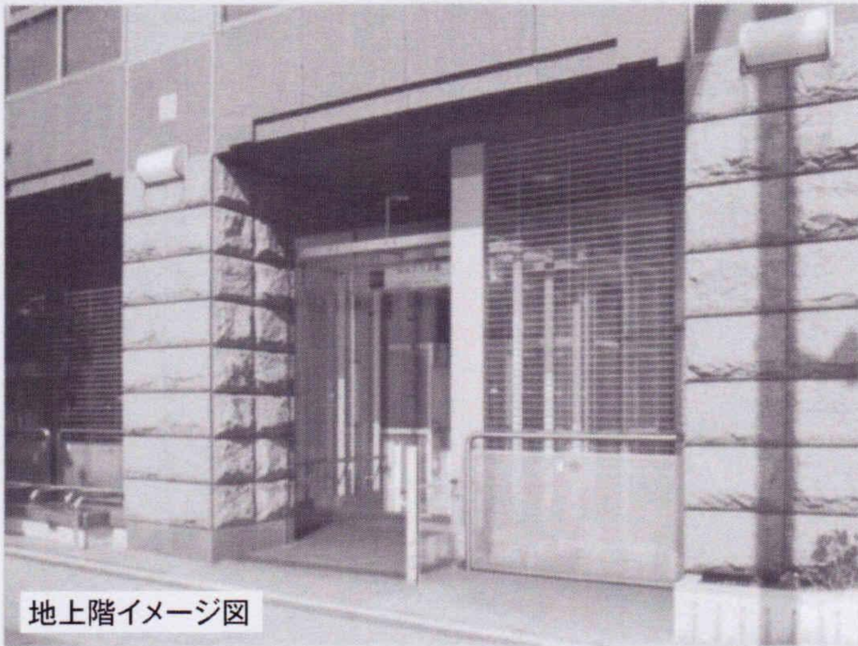
地上階イメージ図